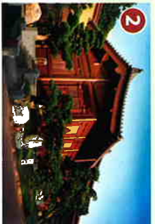
中國木結構建築藝術館