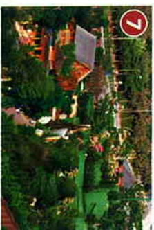
龍門樓 水車磨坊 志蓮素齋 電話:3658 9388