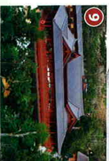
松茶樹 電話:3658 9390